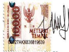
Amelia Kusuma Dewi