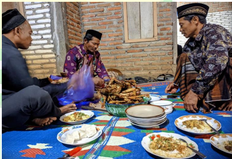
Gambar 10. Kenduri Sepasaran

Kenduri dalam sepasaran pada dasarnya dilakukan untuk memohon keselamatan bayi agar bayi kelak dapat hidup lancar dalam segala hal. Sepasaran biasanya juga diikuti dengan pengumuman nama bayi dan aqiqahan, dimana upacara menjadi semakin meriah.