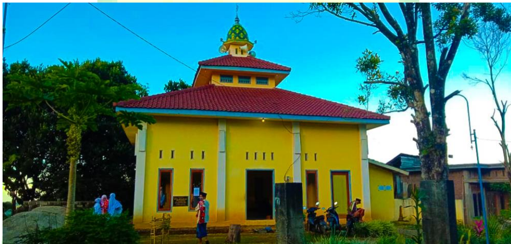
Gambar 1. Masjid Nasyi Alu Kitab Dusun Tumpak Rejo

Meski demikian kegiatan untuk mempersatukan masyarakat kerap dilaksanakan oleh desa sendiri dengan mengadakan arisan RT setiap satu bulan sekali. Dengan diadakannya arisan rutin pada malam senin kliwon, masyarakat jadi tahu menahu tentang keadaan sesama dan tetap menjalin silaturahmi antar warga.