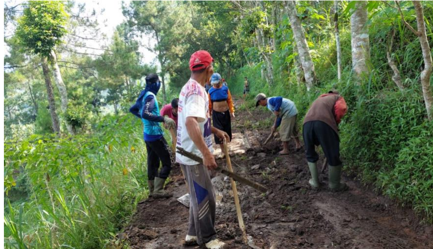
Gambar 8. Kerja Bakti Warga Dusun Tumpak Rejo

Biasanya, kegiatan kerja bakti membersihkan lingkungan sekitar ini dilakukan menjelang hari raya Idul Fitri, Idul Adha, serta pernikahan yang diadakan oleh warga setempat. Dengan membiasakan kegiatan ini, lingkungan sekitar akan lebih bersih dan terhindar dari berbagai penyakit.