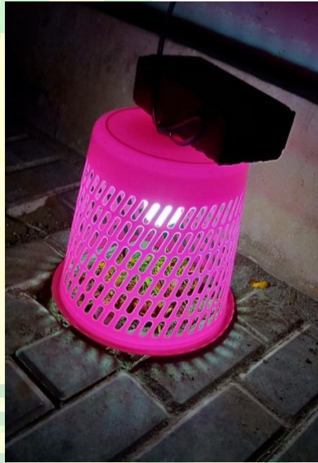
Gambar 9. Tradisi Tanem Ari-Ari

Menanam ari-ari dilakukan oleh ayah sang bayi dengan menanam ari-ari di dalam tanah dekat pintu utama rumah. Setelah ari-ari ditanam, tempat mengubur ari-ari juga dipagari dan diberi penerangan, biasanya berupa lampu minyak selama 35 hari.