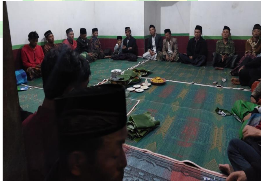
Gambar 11. Tradisi Selamatan Warga Dusun Tumpak Rejo

Bagi warga Dusun Tumpak Rejo, selamatan merupakan ciri khas tersendiri di mana pelaksanaannya dilakukan dengan mengundang warga sekitar agar yang diundang ikut merasakan kebahagiaan. Tradisi ini melambangkan bagaimana solidaritas antar-warga tercermin serta semangat untuk saling memberi. Mereka yang merasakan kebahagiaan ingin juga berbagi kebahagiaan dengan orang di sekitarnya dengan menggelar acara selamatan.