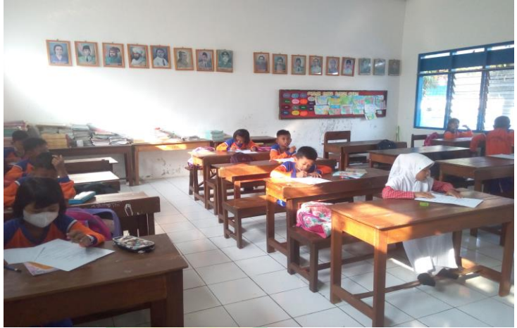
Observasi hasil belajar siswa