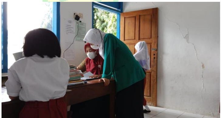
Wawancara guru kelas