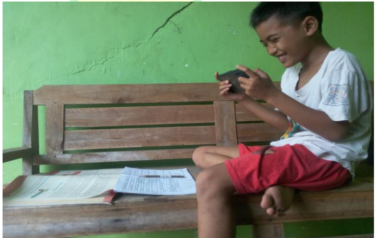
Keadaan siswa belajar dirumah