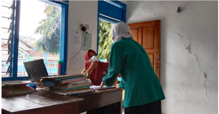
Wawancara guru kelas