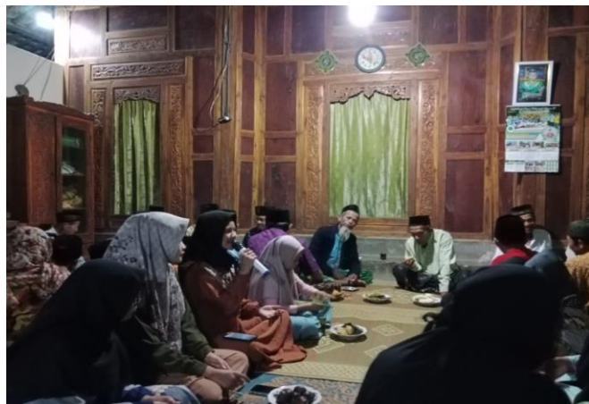
1.4 Dokumenatsi Yasinan