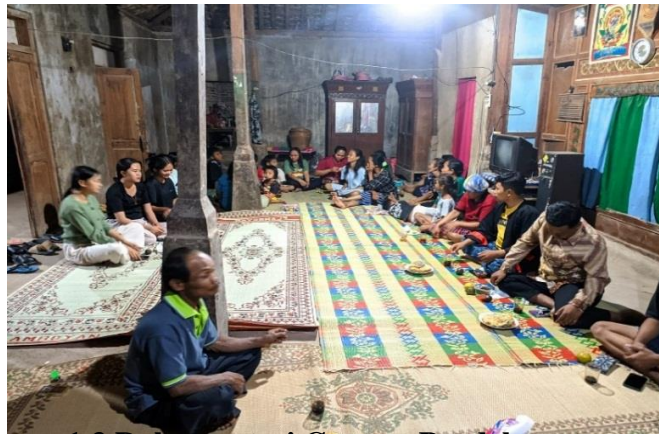
1.3 Dokumentasi Gongyo Pendek