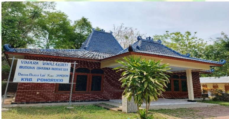
1.14 Vihara Vimalakirti