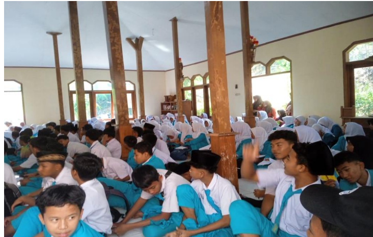
1.3 Dokumentasi Moderasi Beragama Adik-adik Mts