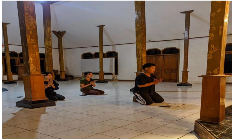
1.6 Sembahyang Umat Buddha