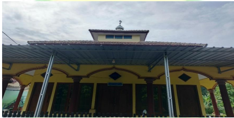
1.7 Masjid Desa Bulu Lor