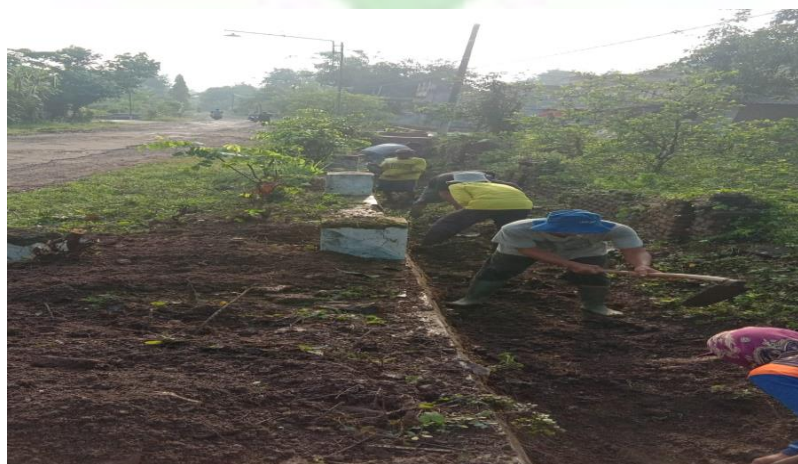
1.5 Kerja Bakti Desa Bulu Lor