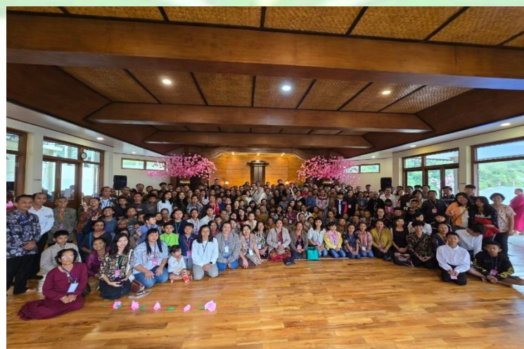
1.2 Dokumentasi Upacara Oesiki