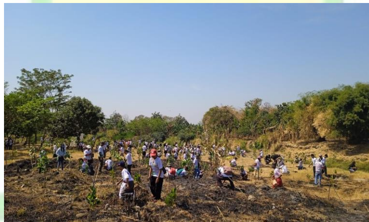
1.4 Dokumentasi GPSK_Gerakan Peduli Sekitar Kita