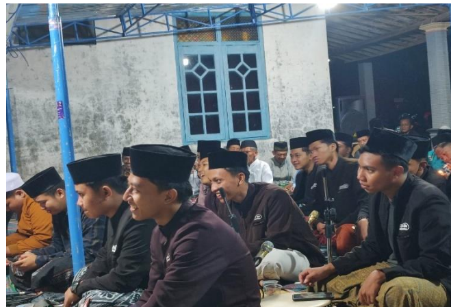
1.6 Dokumentasi Safari Maulid