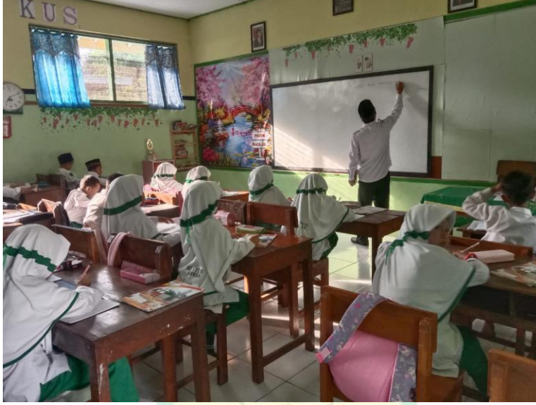
الصورة ٤. ٤ أنشطة التعليم الأساسية للصف الأول

في هذا النشاط الأساسي ، يوفر المعلم مواد إضافية تتعلق بموقع الموقف أو الاتجاه. هذا لأنه في المواد المستفاد في الصف الأول هناك بالفعل عدة كلمات تتعلق بموقع الاتجاه أو الموقف. عند تقديم هذه المادة ، يشرح المعلم الغرض من التعلم ، وهو أن يعرف اتجاه أو موقف كلمات باللغة العربية. بعد ذلك أمر المعلم الطلاب بإعداد دفاتر الملاحظات والقرطاسية. ثم بدأ المعلم في كتابة الكلمات على السبورة.