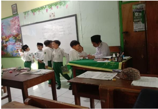
الصورة ٤. ٥ أنشطة ختام التعليم للصف الأول