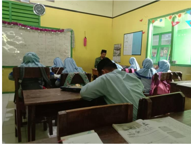
الصورة ٤ . ٨ أنشطة ختام التعليم للصف الرابع