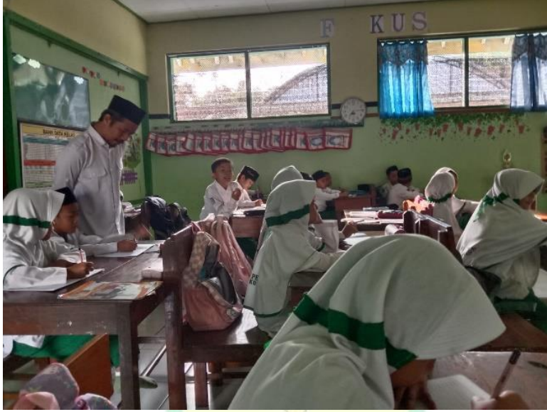
الصورة ٤. ٣ أنشطة تمهيد التعليم للصف الأول

تم تنفيذ نشاط الملاحظة لتطبيق تعلم اللغة العربية من قبل الباحث الأول في الصف ١ ب ، وقد تم تنفيذ هذه الملاحظة في ٩ أبريل ٢٠٢٤ . أ. الأنشطة التمهيدية