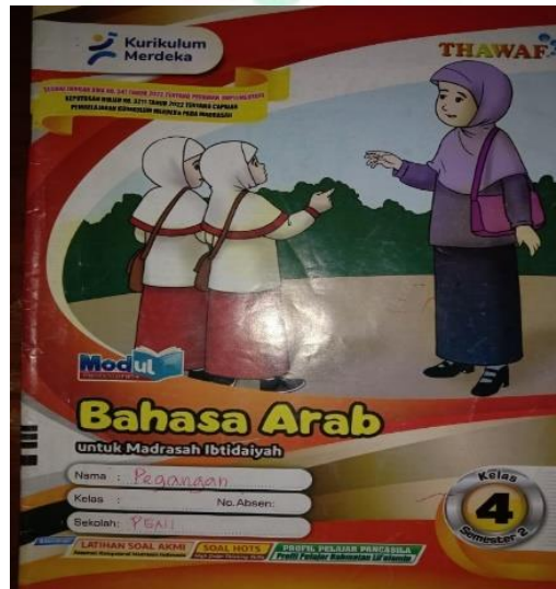
الصورة ٢ . ٤ وحدة تعليم اللغة العربية

"المرجع هو الدليل ، حيث تستخدم هذه المدرسة وحدة نمطية في شكل أوراق عمل الطلاب، ولكن بالنسبة لي لا يتم الحصول عليها من أوراق عمل الطلاب فحسب ، بل تستخدم أيضا كتبا أخرى وكتبا داعمة أخرى. هذا لأنه لا يوجد سوى القليل من المواد في أوراق عمل الطلاب، ثم أشفق على الطفل لاحقا إذا كانت معرفة المواد المقدمة غير واضحة".