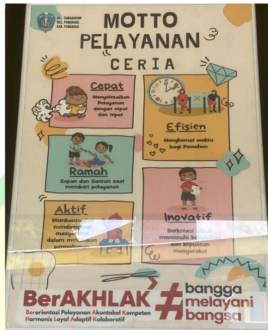
Gambar 4. 3 Berdasarkan Dokumentasi Nomor 04/D/03-4-2024 Motto Kelurahan Tamanarum