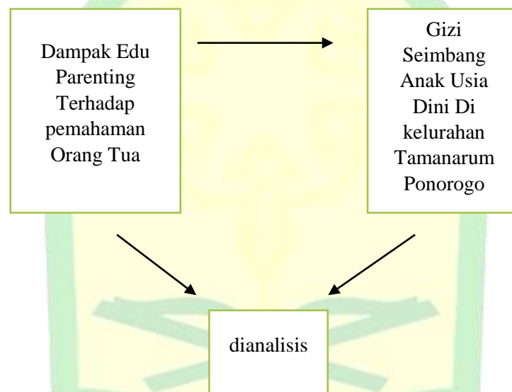
Gambar 2. 1 Bagan Kerangka Berpikir

kelurahan Tamanarum Ponorogo. Adapun sumber sekunder yaitu berupa jurnal serta buku tentang gizi seimbang. Pengumpulan data awal ialah masih banyak terlihat anak kekurangan gizi di kelurahan Tamanarum Ponorogo, sedangkan data yang kedua ini didapatkan dari data awal dihubungkan dengan keadaan orang tua saat ini kurang paham mengenai gizi seimbang anak usia dini.