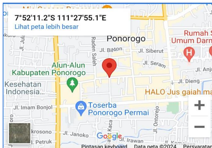
Gambar 4. 2 Berdasarkan Dokumentasi Nomor 06/D/03-4-2024 Lokasi Kantor Kelurahan Tamanarum

Kelurahan Tamanarum merupakan salah satu kelurahan yang berada ditengah kota Ponorogo yang cukup dengan pusat kota juga perkantoran salah satunya kantor Pekab Ponorogo. Adapun luas wilayah kelurahan sekitar 9.609 ha, juga penduduk berjumlah laki-laki 568 jiwa, Perempuan 612 jiwa dengan kepadatan penduduk 1.180 jiwa. Jarak kantor kelurahan dengan lingkungan yang terjauh sekitar 5 menit dan dengan kantor kecamatan sejauh 3 Km, Bentuk wilayah 100% datar dengan curah hujan sedang. Kelurahan ini berbatasan langsung dengan kelurahan Mangkujayan, Borotonegaran, dan juga Nologaten.