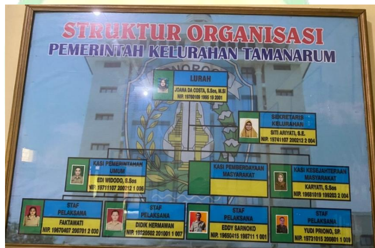
Gambar 4. 1 Berdasarkan Dokumentasi Nomor 03/D/03-4-2024 Skema Struktur Organisasi Kelurahan Tamanarum

Struktur organisasi di Kelurahan Tamanarum Kabupaten Ponorogo terdiri dari :