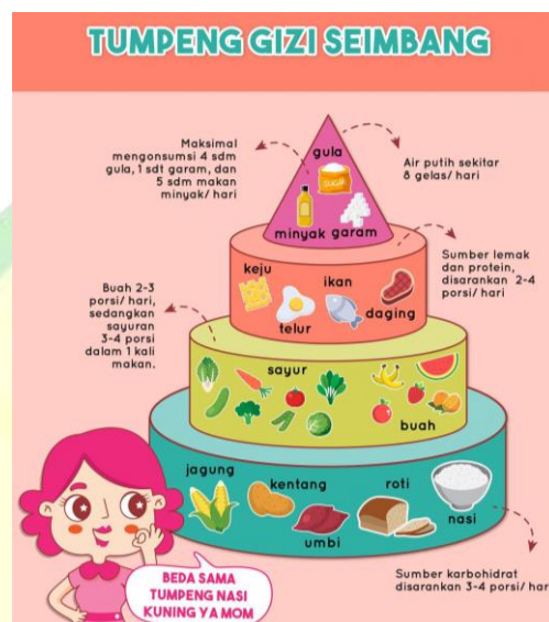
Gambar 4. 4 Piramida Gizi Seimbang pada Anak

buah dan juga telur puyuh rebus. Terdapat anak yang suka makan salad ataupun telur dan juga ada yang suka keduanya. Hal ini dapat dilihat dari gambar gizi seimbang sebagai berikut.