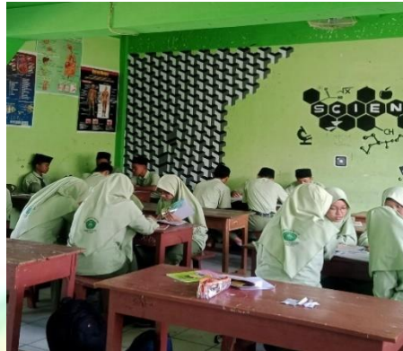
Gambar 4.4 Siswa Belajar Kelompok

Tujuan utamanya adalah agar mengetahui ilmu pengetahuan secara mendalam.