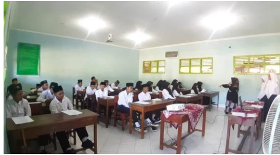
Gambar 4.2 Penggunaan Media Audio Visual

Evaluasi dimaksudkan untuk mengetahui tingkat ketercapaian tujuan-tujuan pendidikan yang ingin dicapai melalui tujuan dan latar belakang pembelajaran. Dalam tahap penutup guru akidah akhlak memberikan kesimpulan mengenai apa yang telah dipelajari siswa selama pembelajaran berlangsung. Guru memberikan rangkuman point-point penting mengenai materi yang dipelajari, peserta didik mengetahui inti dari materi tersebut.