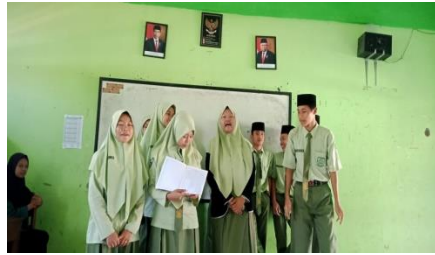
Gambar 4.5 Hukuman Siswa yang Melanggar Peraturan