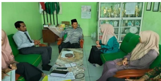
Gambar 4.3 Wawancara Kepala Sekolah

Kegiatan pembiasaan sejauh ini masih berjalan mbak. Di pagi hari itu mbak, ada pembiasaan bersalaman dengan gurunya yang sudah menjaga digerbang. Dan mau tidak mau siswa harus bersalaman dengan guru baik itu siswa yang baik ataupun yang kurang baik. Selain itu juga diberlakukan tata tertib adab terhadap guru dan karyawan. Kemudian ada juga pembiasaan Sholat Dhuha berjamaah. Setelah kegiatan Sholat Dhuha selesai dilanjutkan dengan tausiyah yang pematerinya sendiri dari imam sholat tersebut.