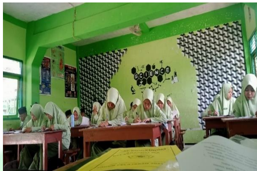
Gambar 4.1 Keadaan KBM di Dalam Kelas

didik merespon dengan menjawab pertanyaan yang diberikan guru yang bersangkutan. Apabila pertanyaan telah dijawab maka guru memperjelas jawaban yang dikemukakan oleh peserta didik.