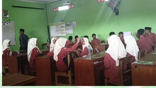
صورة ٤.١ . الملاحظة تطبيق التعليم الترفيهي

"تعمدت عدم مواجهة الطلاب أثناء المباراة، وهو ما كنت قلقا بشأنه إذا كان لدى الطالب دور للإجابة على الأسئلة في بداية اللعبة وكان هناك دب من الأوقات، عندها سيكون لدى الطلاب تصورات سلبية، مثل استهدافهم دائما من قبل المعلم، والشعور بالكراهية، وغيرها لجعل الطلاب أقل شأنًا. منع الاحتمالات السيئة فعلت ذلك".