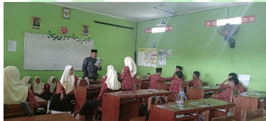
صورة ٤.٢. الملاحظة يحاضر الأستاذ السؤال