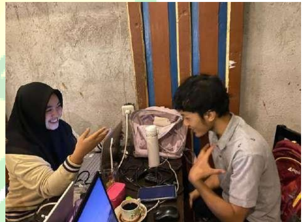
Gambar 5.6 Wawancara narasumber