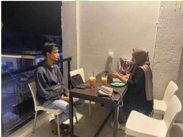
Gambar 5.5 Wawancara narasumber