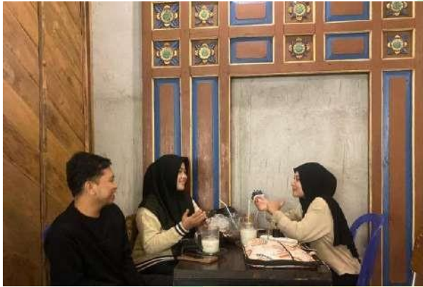
Gambar 5.3 Wawancara narasumber