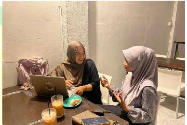
Gambar 5.4 Wawancara narasumber