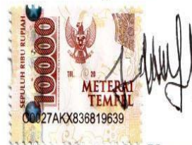
Amelia Kusuma Dewi