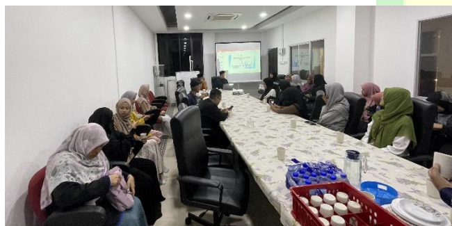
Gambar 3.11. Pertemuan pertama peserta ICSP dengan pihak Madrasah Uthmaniah

“Dalam menjalankan kegiatan di Madrasah Uthmaniah, saya tidak hanya bertemu dengan masyarakat asli Penang yang notabene bisa ditolerir ketika berkomunikasi menggunakan bahasa Melayu. Akan tetapi, beberapa kegiatan yang saya jalankan juga mengharuskan untuk membangun komunikasi dengan warga berdarah India dan Chinese. Oleh karenanya, selain bahasa Melayu saya juga berkomunikasi dengan menggunakan bahasa Inggris” 31