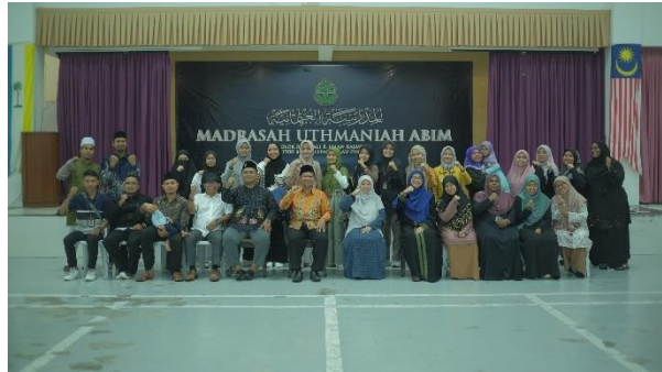
Foto Peserta ICSP 2023 bersama dewan guru Madrasah Uthmaniah