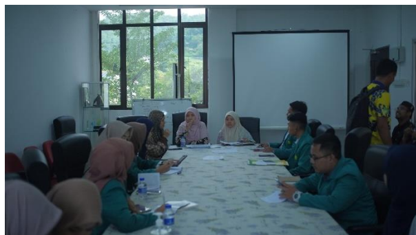
Foto rapat kegiatan harian selama di lingkungan Madrasah Uthmaniah