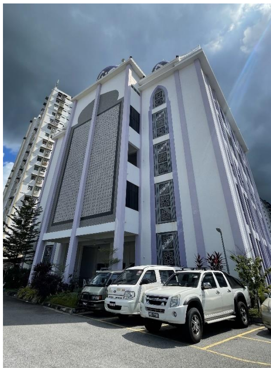
Gambar 3.2. Gedung Madrasah Uthmaniah