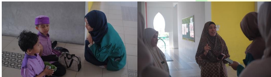
Foto proses komunikasi nonformal peserta ICSP 2023 di lingkungan Madrasah Uthmaniah