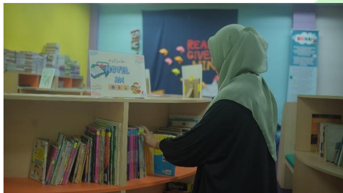
Gambar 3.7. Peserta Danya sedang melakukan tugas perpustakaan