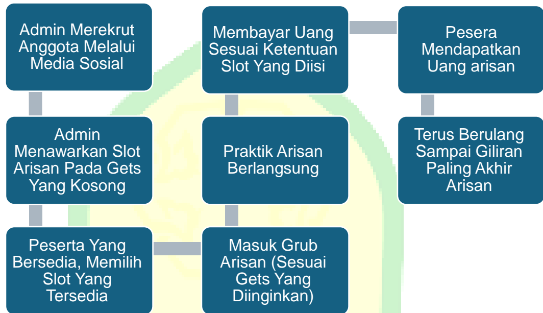
Gambar 2. Alur Arisan Online "Nyell"

Dari adanya tabel tersebut arisan online nyell ini dilakukan dengan 3 tahap besar seperti pelaksanaan pra arisan, waktu pelaksanaan arisan dan pasca arisan. Pra pelaksanaan dalam lingkup ini menggunakan cara admin merekrut anggota melalui media sosial setelah itu admin menawarkan slot arisan pada gets yang kosong dan terakhir peserta yang bersedia mengikuti arisan ini dapat memilih slot yang tersedia.