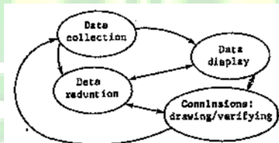
Gambar 1 Kerangka analisis data kualitatif by Miles and Huberman

data menurut Miles, Huberman, dan Saldana menyebutkan bahwa kondensasi data harus memusatkan, menggolongkan, membuang data yang kurang berperan dalam penelitian agar didapatkan kesimpulan. 19 Display data atau penyajian data adalah langkah mengorganisasikan data agar mudah untuk dianalisis dan selanjutnya dapat disimpulkan. 20 Peneliti memperoleh data dari hasil observasi, wawancara, dan dokumentasi secara umum mengenai kesadaran hukum pelaku UMKM terhadap program sertifikat halal yang terfokus pada jaminan kehalalan produk yang kemudian peneliti melakukan kondensasi data karena akan dialihkan menjadi bentuk naratif, kemudian tahap terakhir adalah melakukan kesimpulan mengenai objek kajian penelitian.