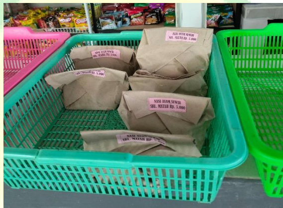
Gambar 3 2: Nasi Ayam Suwir

Tarmi tinggal di Desa Ngrupit, Kecamatan Jenangan, Kabupaten Ponorogo. Tarmi awalnya berasal dari Kalimantan dan pindah ke Ponorogo untuk menetap. Beliau merupakan salah satu pelaku UMKM di Kansa IAIN Ponorogo yang telah beroperasi selama sekitar 2 tahun. Usahanya berfokus pada penyediaan nasi dan ayam suwir kecil dengan tambahan sambal.