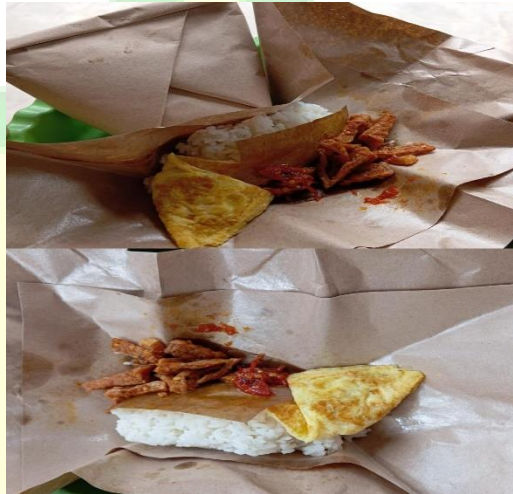
Gambar 3 1: Nasi Kucing

Fokusnya adalah menyediakan nasi kucing dengan beragam jenis lauk seperti telur suwir, tahu, dan tempe kering. Dia dikenal sebagai seorang pelaku UMKM yang sangat rajin dan disiplin, terlihat dari kebiasaannya datang pagi dan menyusun makanan dengan rapi di rak.