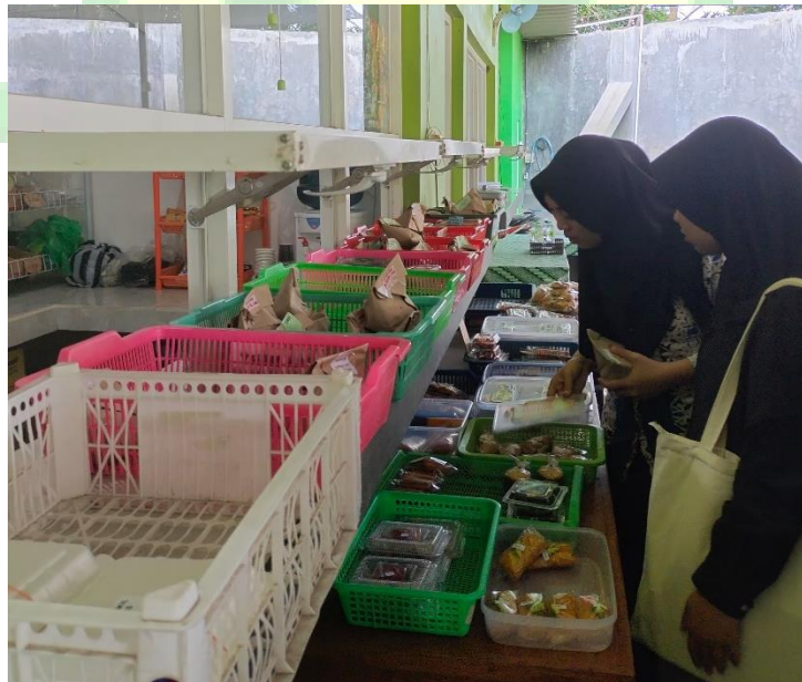
Gambar 3 4: Pelaku UMKM Menyusun Makanan

Saat tiba di Kansa, langkah pertama yang mereka lakukan adalah merapikan makanan yang akan mereka jual. Mereka dengan cermat menyusun produk-produk makanan mereka di tempat rak yang telah disiapkan secara khusus. Dengan tangkas, mereka meletakkan produk-produk tersebut dengan rapi dan teratur, sehingga memudahkan para konsumen untuk melihat dan memilih produk yang mereka inginkan. Selain makanan, para pelaku UMKM juga memiliki minuman sebagai bagian dari penawaran mereka. Untuk menjaga kualitas dan kesegaran minuman, mereka dengan sigap memasukkan minuman tersebut ke dalam tempat pendingin, yaitu kulkas. Dengan langkah ini, mereka tidak hanya menunjukkan kedisiplinan dalam penyediaan produk, tetapi juga memastikan bahwa kualitas produk yang mereka tawarkan tetap terjaga hingga saat konsumen membelinya.