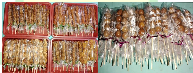
Gambar 3 3: Sosis dan Puyuh Bacem

Rifqi tinggal di tinggal di Desa Sukun, Kecamatan Pulung, Kabupaten Ponorogo. Beliau adalah salah satu pelaku UMKM di Kansa IAIN Ponorogo sekitar 5 tahun. Usahanya berfokus pada penyediaan sosis dan puyuh bacem yang dikemas dengan rapi menggunakan kemasan mika.