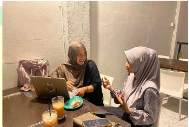
Gambar 5.4 Wawancara narasumber