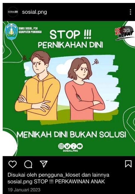
Gambar 3.2 Poster Stop Perkawinan Anak

Poster di atas mengajak seluruh masyarakat baik remaja dan orang tua untuk bekerja sama dalam mencegah pernikahan pada anak. Melalui platform instagram Dinas sosial P3A yang bernama “sosial.png” poster sebar luaskan melalui media sosial karena cara tersebut paling efektif. Dinas sosial tidak hanya melakukan upayanya dengan satu cara membuat poster, tetapi juga membuat video pendek. Video pendek ialah salah satu bentuk karya paling sederhana dengan durasi 60 detik dan berisi materi-materi yang disampaikan dengan baik. Bentuk video pendek yang dibuat oleh Dinas Sosial P3A yang dibantu oleh PAP sebagai berikut. 22