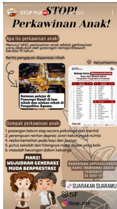
Gambar 3.5 Poster Kampanye “Stop Perkawinan Anak”

instagram resmi milik PAP yang bernama “pap_rekk”. Berikut bentuk poster kampanye tersebut yaitu: 31