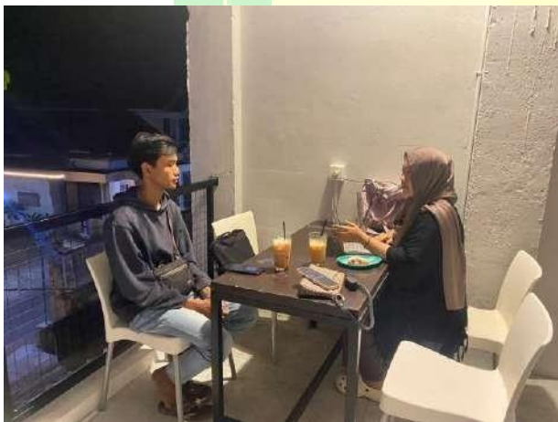
Gambar 5.5 Wawancara narasumber