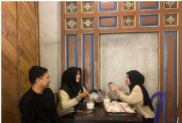
Gambar 5.3 Wawancara narasumber