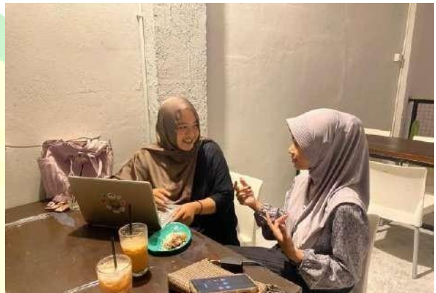
Gambar 5.4 Wawancara narasumber