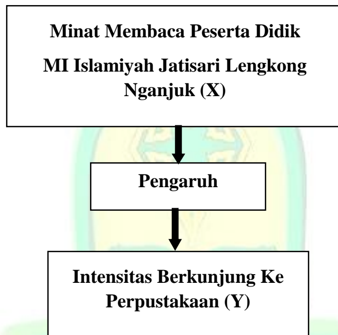
Gambar 2.1 Kerangka pikir Penelitian

Selanjutnya, terkait dengan variabel-variabel penelitian yang meliputi minat membaca peserta didik dan intensitas berkunjung ke perpustakaan sekolah, kerangka pemikiran penelitian ini dapat digambarkan sebagai berikut :