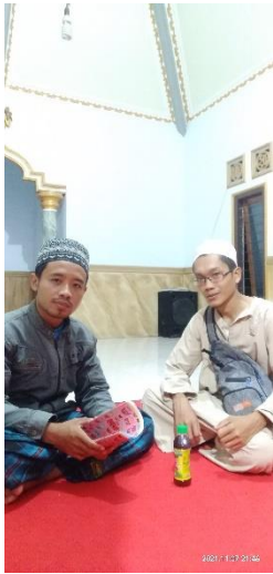
Wawancara dengan guru nahwu Madrasah Diniyah Al-fatah