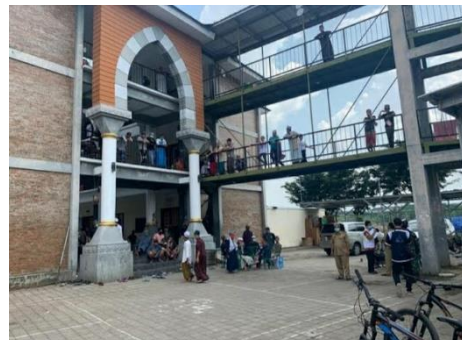
Foto Madrasah Diniyah Al-fatah Temboro Karas Magetan