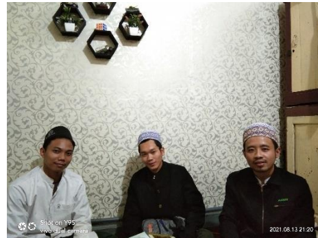
Wawancara dengan pengurus bagian kependidikan dan kurikulum Madrasah Diniyah Al-fatah