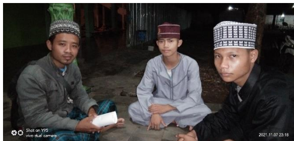
Wawancara dengan siswa kelas 4 Madrasah Diniyah Al-Fatah