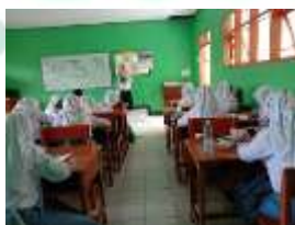
Gambar 3.2 Membantu Guru Mengkoreksi dan Menghitung Menggunakan Kalkulator

Hal tersebut juga diperkuat oleh gambar di atas berdasarkan hasil temuan melalui pengamatan yang dilakukan oleh peneliti yang mana bentuk tolong-menolong yang dilakukan siswa juga tidak hanya melulu terkait materi namun juga tenaga. Sebagaimana observasi yang dilakukan peneliti pada tanggal 9 Februari 2022 di lingkungan SMAN 1 Slahung Ponorogo yang mana terdapat siswa yang mengantarkan dan mengambil masker di stand pengecekan suhu. Selain itu, siswa tersebut membantu memasang masker temannya. Hal tersebut, selain peduli terhadap temannya juga menunjukkan sikap peduli terhadap lingkungan sekitar sekolah dalam menjaga kesehatan terlebih pada masa pandemi Covid-19 seperti saat ini yang mengharuskan siswa menjaga kesehatan serta antara siswa satu dengan yang lainnya saling mengingatkan untuk menjaga protokol kesehatan.