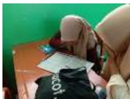
Gambar 4.1 Berbagi Buku LKS dengan Teman di Kelas XI IPS

saat itu tidak membawa HP. Sehingga, berdasarkan gambar di atas juga menunjukkan bahwasannya siswa tergerak untuk ingin membantu seorang guru dalam menghitung total dari hasil pembahasan menggunakan kalkulator yang ada di gadget siswa. Perilaku siswa tersebut di samping dapat meringankan guru juga pekerjaan cepat selesai.