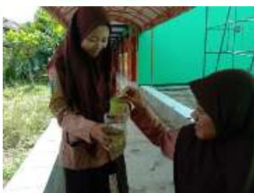
Gambar 2.1 Kegiatan Juma't Amal di SMAN 1 Slahung Ponorogo