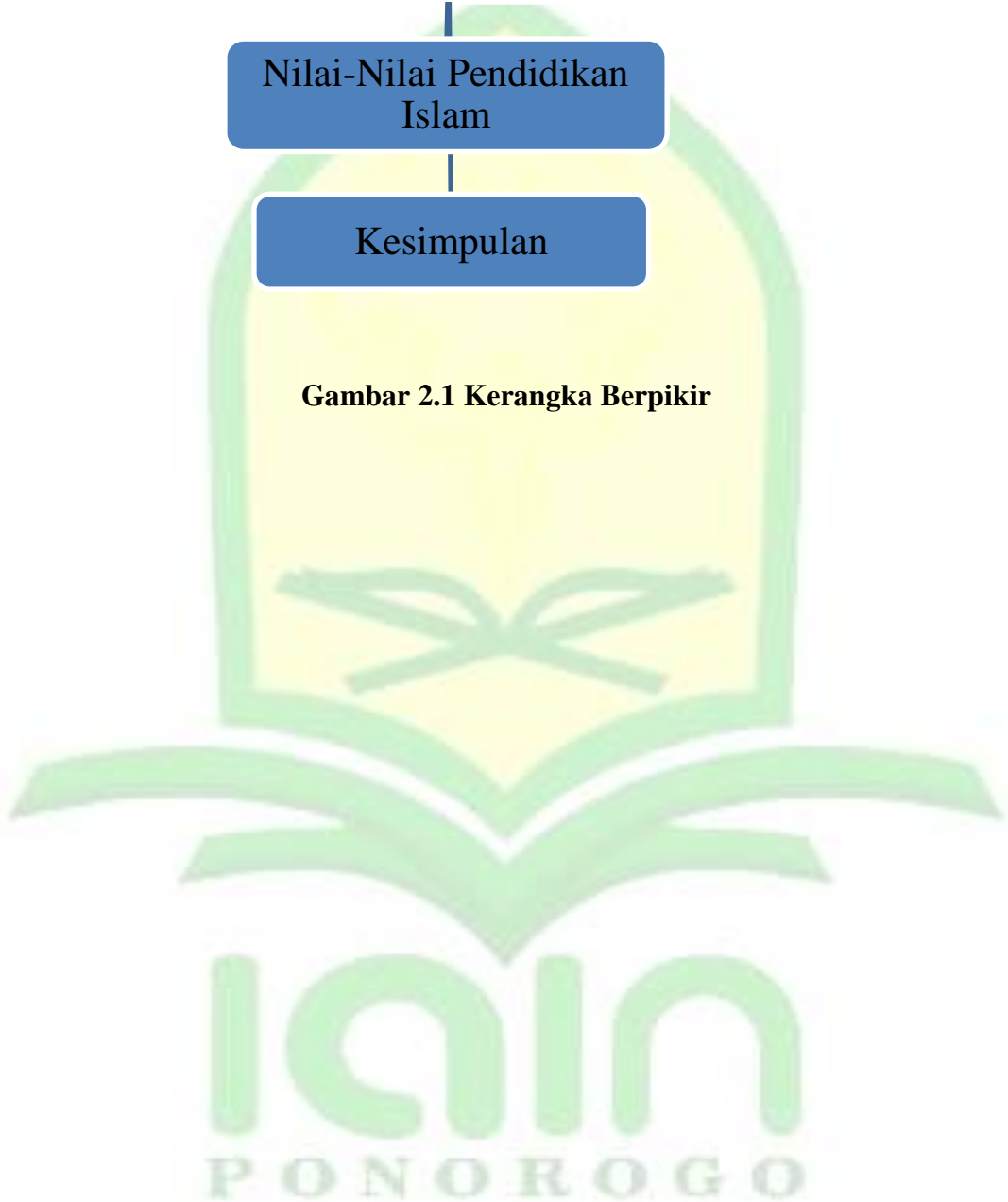
Gambar 2.1 Kerangka Berpikir