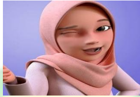
Gambar 1.6 Tokoh sebagai tante animasi Nussa dan Rarra

Tante dewi pertama kali muncul dalam episode “Bukan Mahram”. Karakter tante dewi sebagai adik kandung dari Umma. Jadi, tante Dewi merupakan tante dari Nussa dan Rarra. Tante Dewi merupakan seorang guru PNS beliau sangat menyukai Nussa dan Rarra.