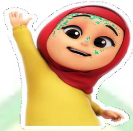
Gambar 1.2 Tokoh adik perempuan animasi Nussa dan Rarra

Rarra merupakan adik perempuan Nussa. karakter Rarra dalam animasi ini digambarkan sebagai anak perempuan yang periang, lucu dan energik serta mempunyai rasa keingintahuan yang tinggi dengan menggunakan gamis dan jilbab. Ia berumur 5 tahun dan suka sekali bermain dengan Nussa dan kucing kesayangannya. Rarra merupakan sosok adik yang penurut dan patuh kepada orang tuanya. Rarra juga suka menolong dan peduli terhadap sesama.