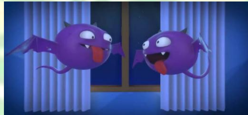
Gambar 1.5 Tokoh setan animasi Nussa dan Rarra

Setan dalam animasi ini digambarkan seperti kelelawar mempunyai ciri-ciri wajah bulat tubuh berwarna ungu pekat, mempunyai tanduk dan bisa terbang. Setan selalu menggoda Nussa dan Rarra untuk melakukan perbuatan yang buruk. Namun Nussa sekeluarga tidak dapat melihatnya hanya Antta kucing kesayangan Rarra yang bisa melihatnya. Sosok setan ini bisa diusir dengan menggunakan bacaan bismillah. Ketika setan berhasil menggoda Nussa dan Rarra badan setan mulai membesar, namun ketika setan gagal menggoda Nussa dan Rarra badan setan mulai mengecil dan menghilang.