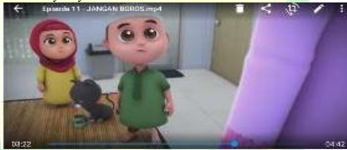
Gambar 1.8 Nussa dan Rara sedang mendapat nasehat dari Umma

Umma : "berarti kalian itu mubadzir, pemborosan. Mubadzir itu temennya syaitan loh"