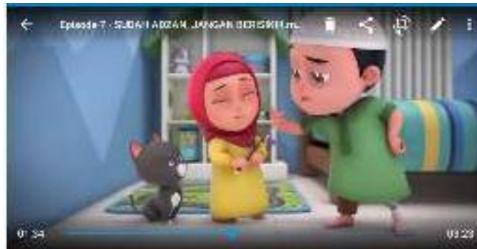
Gambar 1.8 Nussa sedang memberi pengertian pada Rara agar tidak berisik saat adzan berkumandang

Keempat, pada episode “Jumat Hari Raya” aspek ilmu berupa pengetahuan dan pembelajaran tentang amalan-amalan atau hal-hal yang dilakukan di hari jumat. Hari jumat adalah salah satu hari yang dimuliakan, maka dari itu beberapa amalan dianjurkan agar memperoleh keberkahan di hari jumat. Amalan yang disampaikan lewat lagu Nussa dan berisi yang pertama adalah membersihkan anggota tubuh dengan cara mandi, sikat gigi, memotong kuku, memakai baju bagus dan juga memakai minyak wangi, serta membaca surat -al-kahfi .