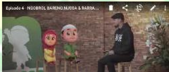
Gambar 1.11 Nussa dan Rara sedang menghadiri acara talkshow

Host :”Sorry, sorry bang Rio yang salah, bang Rio minta maaf ya harusnya kalian nyebut salamnya disini aja gausah ke depan kamera, nanti kalo udah tiga, dua kamu baru nyebut salam, oke?”