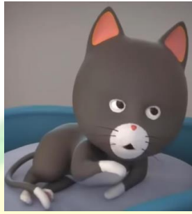
Gambar 1.4 Tokoh kucing animasi Nussa dan Rarra

Karakter Antta adalah sebagai kucing rumahan peliharaan Nussa dan Rarra. Sifat Antta sama seperti kucing-kucing di dunia nyata yaitu suka bermain, manja, banyak makan, memiliki rasa penasaran, dan menggemaskan. Antta memiliki kekutan khusus yaitu bisa melihat dan merasakan kehadiran setan. Antta senang bermain dengan Rarra dan Nussa dan selalu dekat dengan Nussa dan Rarra.