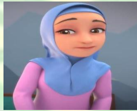
Gambar 1.3 Tokoh Ibu animasi Nussa dan Rarra

Karakter Umma di sini sebagai ibu dari dua bersaudara yaitu Nussa dan Rarra. Umma memiliki sifat yang penyayang, lembut, baik dan juga taat beragama. Umma menjadi sosok ibu yang sholikhah. Namun karakter Umma tidak ditampilkan secara penuh di video atau jarang muncul di layar kaca.