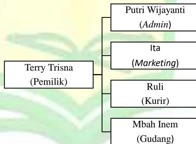
Gambar 1.1 Susunan Personalia Allbe There Online Shop Ponorogo