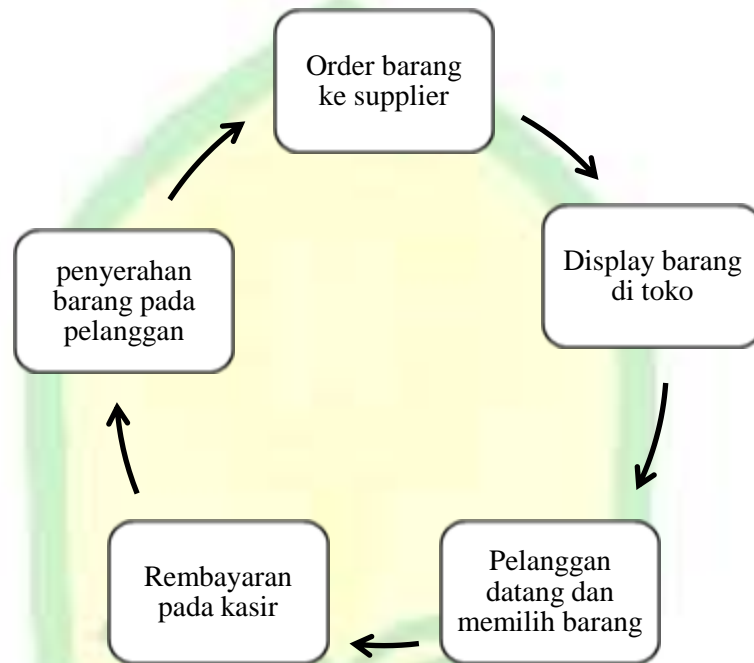
Gambar 1.3 Mekanisme Order Via Offline