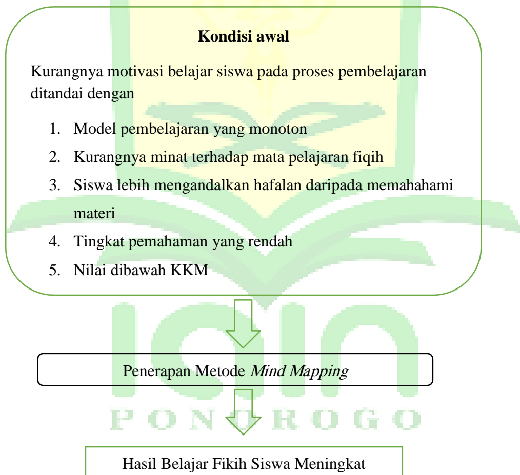
Gambar 2.1 Kerangka berfikir

Kerangka berfikir dapat digambarkan sebagai berikut: