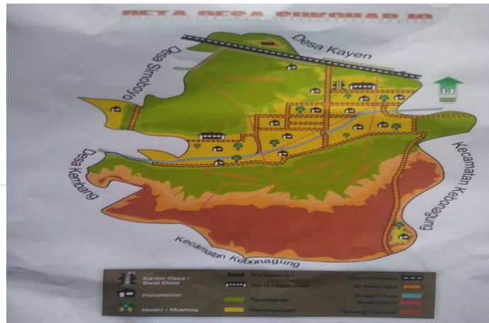
Gambar 4.1 Peta Desa dan Batas Wilayah Desa Sukoharjo.

Iklim Desa Sukoharjo seperti halnya desa-desa lain di wilayah Indonesia yang beriklim tropis. Ada dua musim yakni musim kemarau dan musim penghujan. Hal tersebut mempunyai pengaruh langsung terhadap pola tanam yang ada di Desa Sukoharjo Kecamatan Pacitan.