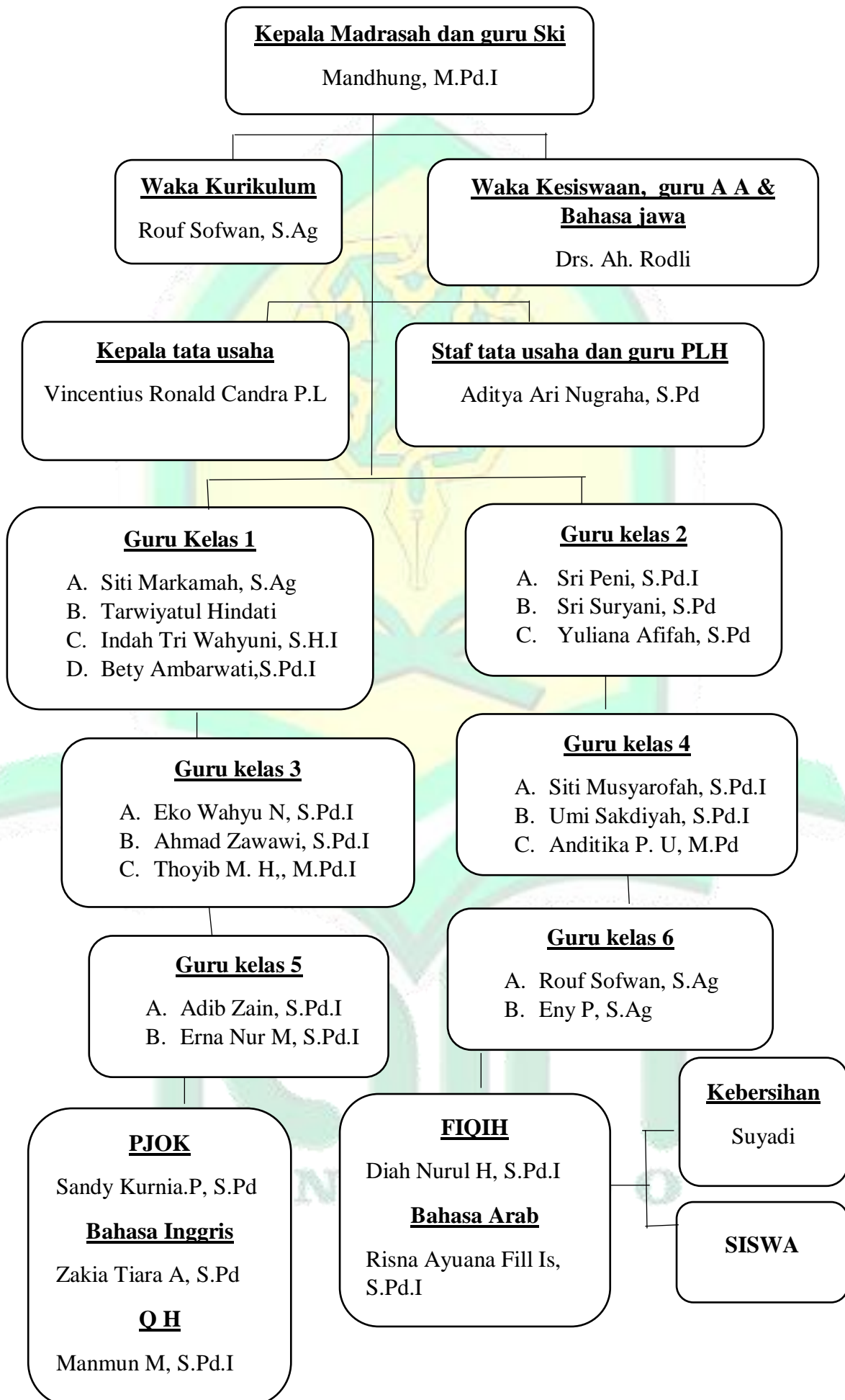
Gambar 4.1 Struktur Organisasi MI Sailul Ulum Pagotan Madiun